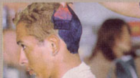
Cara de incertidumbre... Los tres ciclistas terminaron satisfechos con sus peinados, hechos con productos de calidad.